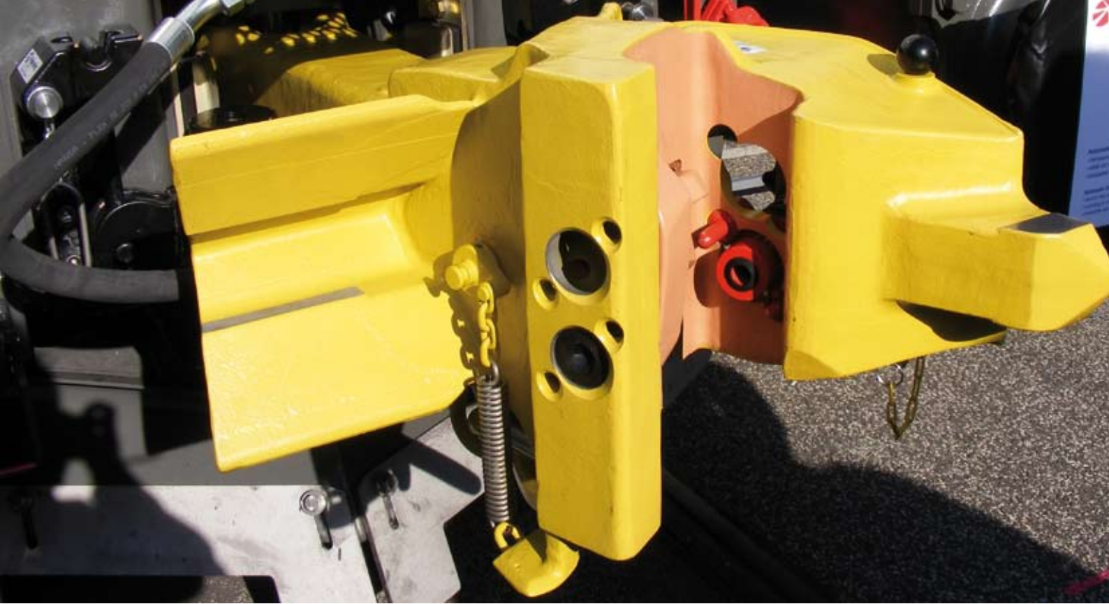
TRANSPACT-Mittelpufferkupplung (C-AKv) an einem Vectron-Prototyp bei der InnoTrans 2010

zweiachsige Wagen im Bestand. Es kommen fast nur noch Drehgestellwagen zum Einsatz. Zunehmend werden auch mehrteilige Wagen beschafft (beispielsweise Containertragwagen oder Autotransportwagen). Hierdurch ist die absolute Zahl der eingesetzten Güterwagen in Deutschland seit Beginn der 90er Jahren um über 50 Prozent gesunken. Eine Umrüstung der Wagenflotte wäre folglich inzwischen deutlich günstiger.