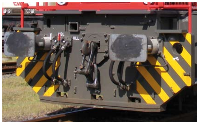
Die Schraubenkupplung – eine Technologie aus dem 19. Jahrhundert

Auch hat die Anzahl der Güterwagen in den vergangenen Jahren deutlich abgenommen. Ursache hierfür ist zum einen der drastische Rückgang im klassischen Wagenladungsverkehr, andererseits benötigt man dank optimierter Produktionsformen (mehr Ganzzugverkehre und Kombiniertes Ladungsverkehr) inzwischen ohnehin weniger Wagen, da sich die Wagemumläufe und die Laufleistung deutlich erhöht haben. Weiterhin findet man nur noch zu einem kleinen Prozentsatz